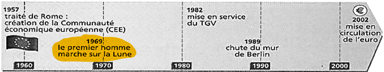
Doc. 5 : Une frise chronologique historique moyenne